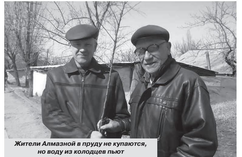
Жители Алмазной в пруду не купаются, но воду из колодцев пьют

P.S. Газета будет следить за дальнейшим развитием событий в Алмазной и информировать читателей о решении экологических проблем региона.