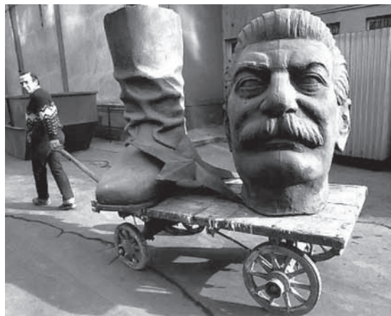
Коммунистическая партия Украины объявила о намерении установить ко дню Победы 9 мая 2010 года в Жовтневом районе Запорожья памятник Сталину. На первый взгляд в том, что в нашем трудовом городе, не выделяющемся среди других городов обилием памятников и других культурных ценностей, появится ещё один культурологический объект, ничего плохого нет. Однако это только на первый взгляд...