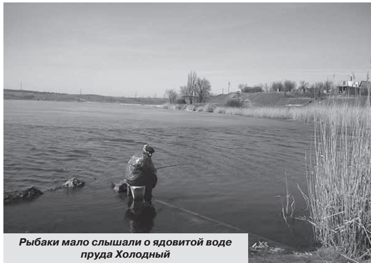
Рыбаки мало слышали о ядовитой воде пруда Холодный

Почему за столько лет в Алмазной нет массового экологического общественного движения? Ведь вы пьете «мертвую воду», едите отравленные овощи, ловите ядовитую рыбу! Почему не настаиваете на том, чтобы экологические сборы, которые платят местные предприятия, шли на решение местных экологических проблем, а не в Киев? Почему вы смиренно принимаете самые ошибочные решения местной власти, которые задевают не только ваше здоровье, но и наносят вам прямой материальный ущерб, заставляя уезжать и распродавать свои дома и дачи за копейки? А ведь могло быть иначе: те же нынешние киевляне, луганчане, москвичи, у которых родители остались в Алмазной, могли бы вкладывать свои заработанные деньги в строительство дач и домов. Чтобы внуки алмазянцев отдыхали