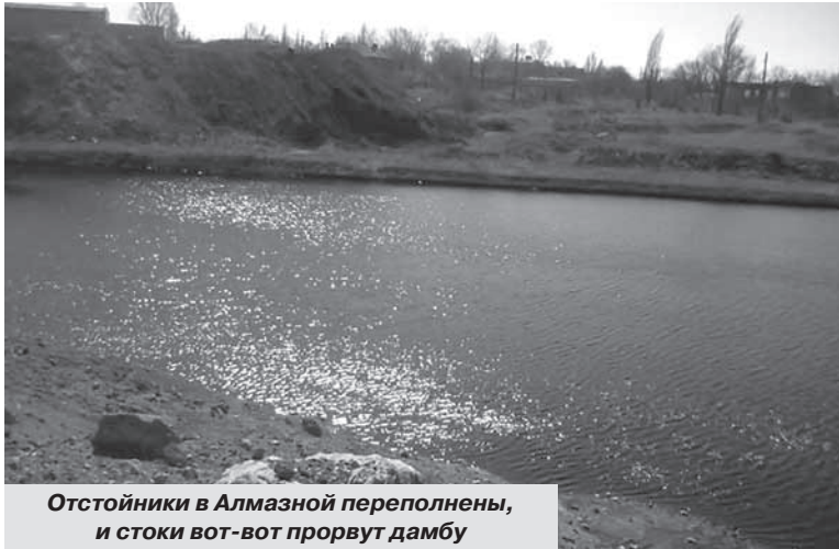
Отстойники в Алмазной переполнены, и стоки вот-вот прорвут дамбы

батареи или нет света, какие колдобины на дорогах и ходит ли городской транспорт. Они не дышат с местными жителями одним воздухом – в прямом и переносном значении. И это очень снижает шансы