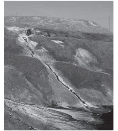
Стоки разъедают землю и уничтожают все живое вокруг

Слишком много накопилось вопросов, на которые нет ответов. Люди устали от тяжелой жизни, они не верят, что их проблемы можно решить. Некоторые из них даже готовы закрыть глаза и уши, чтобы не знать, как все плохо вокруг них. Допустим, купаться в пруду Холодный ни взрослым, ни детям нельзя. А где купаться? В бассейне? Такого выбора здесь нет. Зимой и летом люди ловят в пруду рыбу. И даже когда она пахнет, как в аптеке, они ее едят. Потому что другой