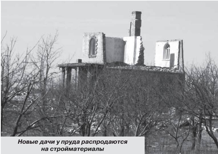
Новые дачи у пруда распродают на стройматериалы

в два раза, а в отдельных местах – в сотню раз.