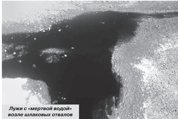
Лужи с «мертвой водой» возле шламовых отвалов

Гуляя по улицам Алмазной, видишь одинаковые запыленные крыши домов, старые заборы. Во